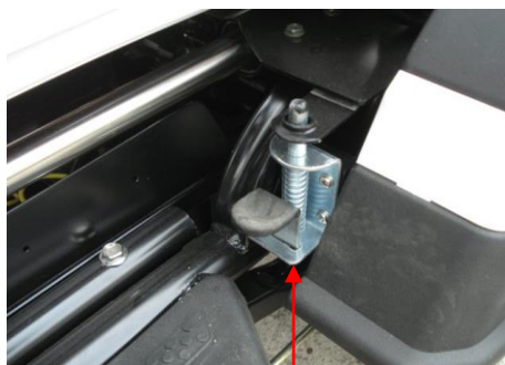
Ülés helyzetének rögzítési pontja