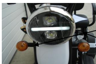
Első irányjelző (bal, jobb)

Első irányjelző: 48V 5W izzó Első égő: 48V LED izzó Első helyzetjelző: 48V LED izzó Hátsó irányjelző: 48V LED égő Hátsó égő: 48V LED izzó