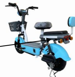
töltő csatlakozó aljzat

A főbiztosíték az akkumulátor dobozban belül került elhelyezésre meghibásodása esetén forduljon szakemberhez.